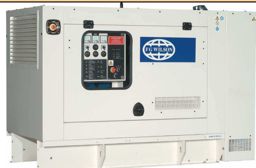
27 à 110 kVA insonorisé