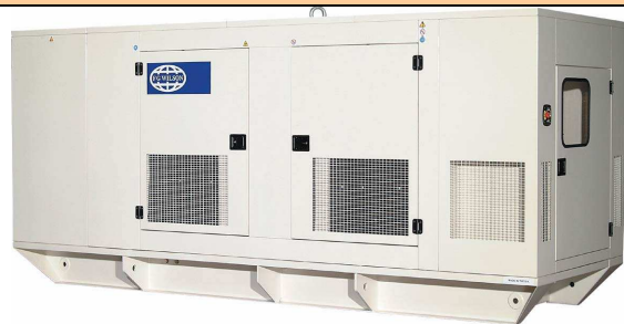
300 à 450 kVA conteneurisé