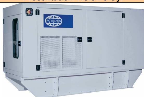
Présentation Vision 6 Cyl