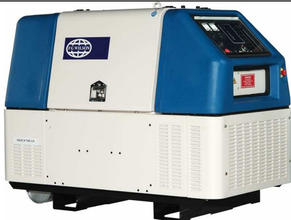
10-22 kVA insonorisé