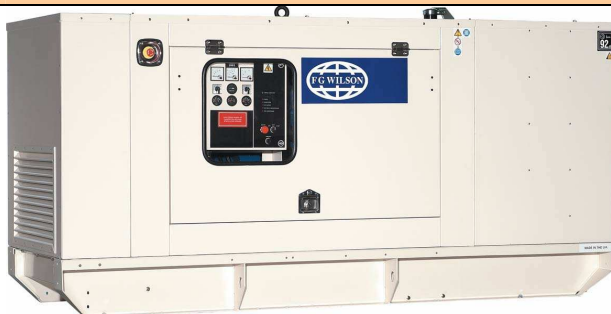
27 à 110 kVA insonorisé