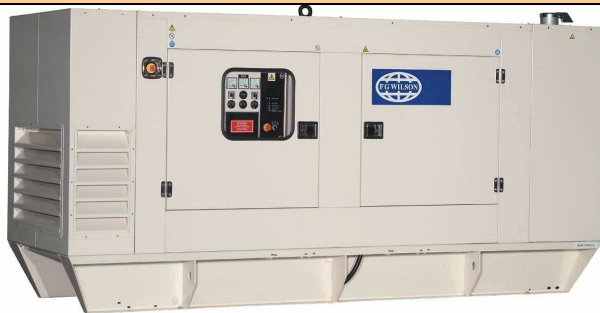
160 à 275 kVA insonorisé