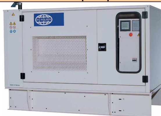
Présentation Vision 3 Cyl