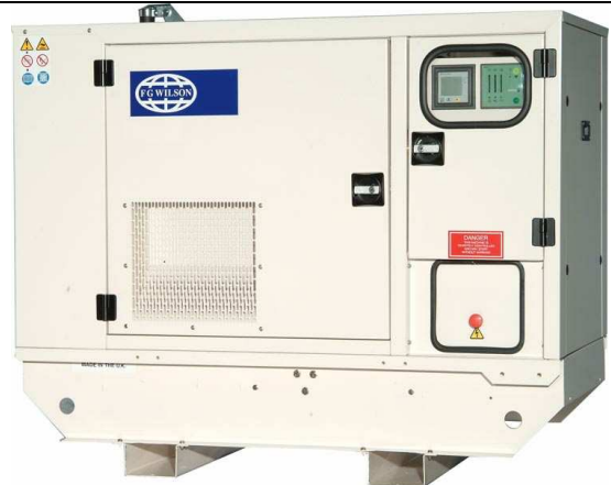
10 à 35 kVA insonorisé