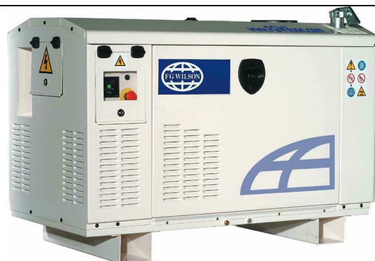
Petit Groupe Capoté