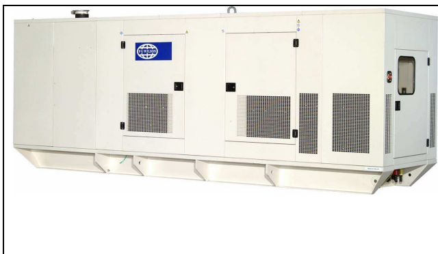
450 à 688 kVA conteneurisé